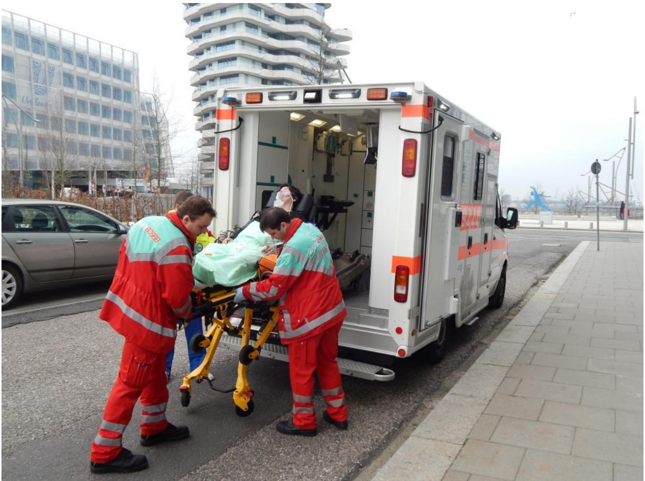
Bildunterschrift: Rettungstransport, Notfallversorgung von Patienten und Reanimationstraining – bei der Intensiven MSH sind Besucher hautnah dabei, wenn jede Sekunde zählt.